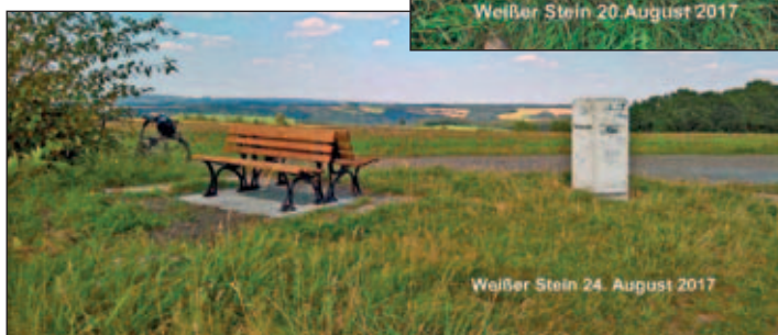
Weißen Stein 24. August 2017