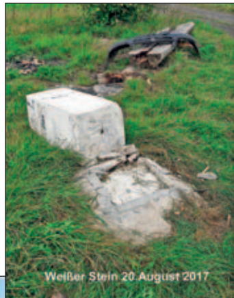
Weißen Stein 20. August 2017